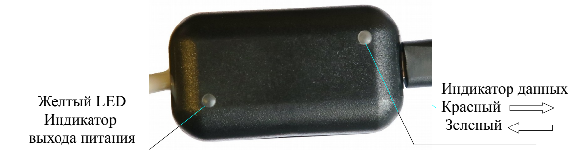
Рис. 3. Конвертер в сборе