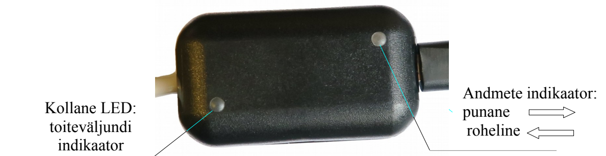
Joon 3. Konverter kokkupandud kujul.